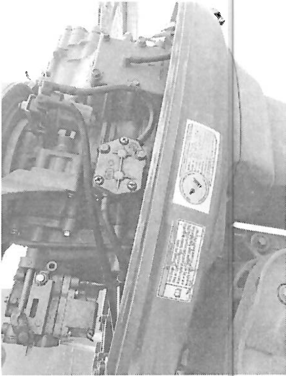
MOTOR 40 HP YAMAHA