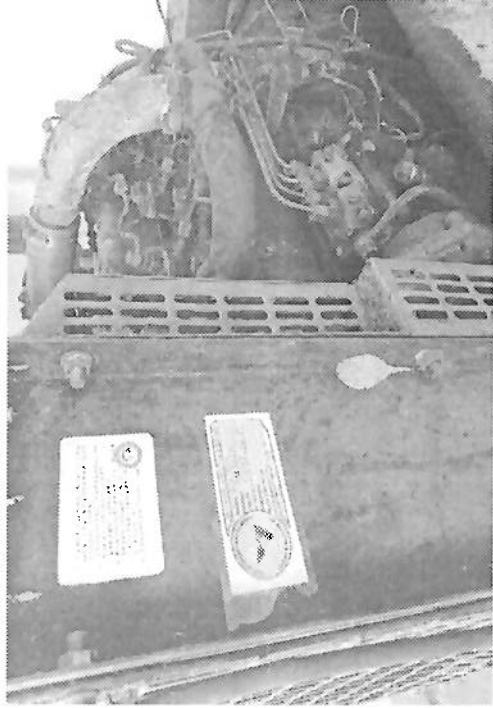
GENERADOR DIESEL MARCA GENPACK