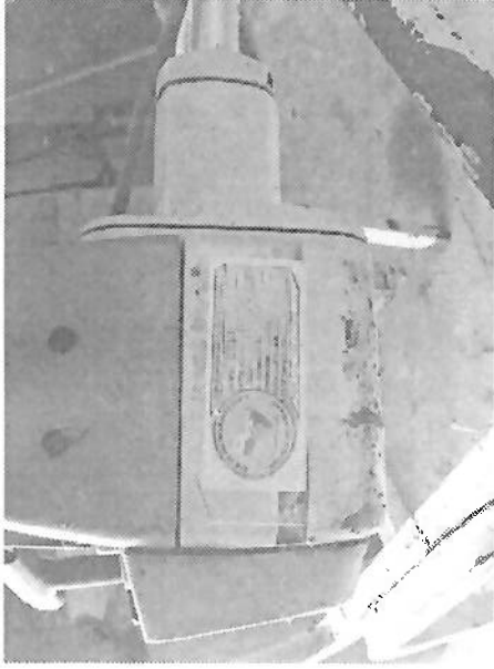
MOTOGUADAÑA MARCA STHIL