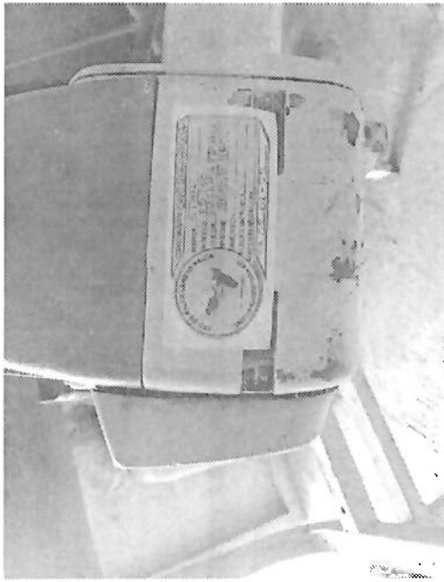
MOTOGUADAÑA MARCA STHIL