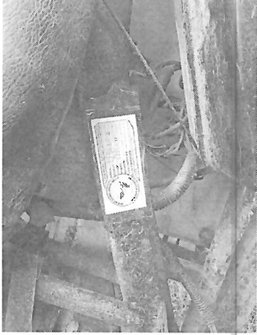
TRIMOTO DE CARGA MARCA LIFAN